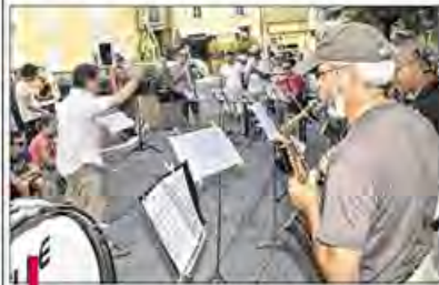
Hier soir, à Cadenet, sur la place du Tambour-d'Arcole, l'ouverture du festival, sur l'air du Boléro de Ravel.

● L'ouverture en fanfare, hier, du festival. Hier, l'ouverture du festival s'est faite sur trois sites : à 15h30, à Aix-en-Provence, place de l'Hôtel-de-Ville ; à 17h30, à Cadenet, place du Tambour d'Arcole, sur l'air du Boléro de Ravel ; et à 19h à Lourmarin, place Barthélémy... avec l'incomparable Big Band Aix-Saunary du pétilant Didier Huot et sa vingtaine de musiciens passionnés à la débauche d'énergie communicative. A.C.