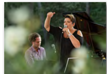
Domaine de Fontenille Lauris 20 août