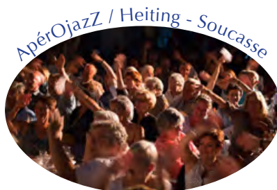
Domaine de Fontenille Lauris 20 août