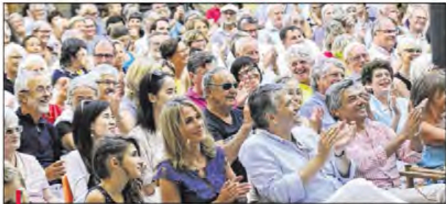
Dans la cour du château de Mirabeau, les artistes ont mis les zygomatiques des spectateurs à rude épreuve. Un régal !