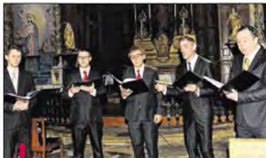
Les chanteurs ont conquis le public réuni à l'église d'Ansois.

Printemps, été, automne, hiver, les incroyables bénévoles du Festival Durance Luberon sont toujours présents! Après une saison d'été particulièrement réussie, les voilà à nouveau sur le pont pour présenter leur festival d'automne. Samedi dernier à l'église d'Ansois, les amateurs de musique ancienne et de chants sacrés ne s'étaient pas trompés en assistant au magnifique voyage autour de la Méditerranée proposé par l'ensemble vocal a cappella "Calisto" composé de 5 chanteurs professionnels.