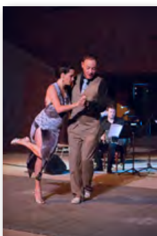
St Estève Janson Vallon de l'Escale 21 août