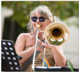
Lourmarin 8 août