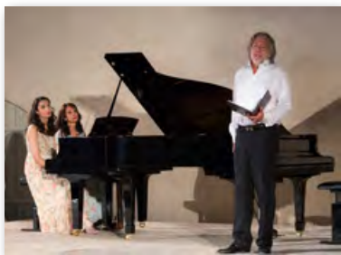
Château Paradis Le Puy Ste Réparate 12 août