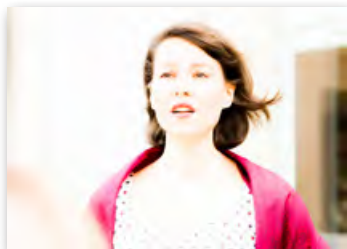
Château La Verrerie Puget-sur-Durance 15 août