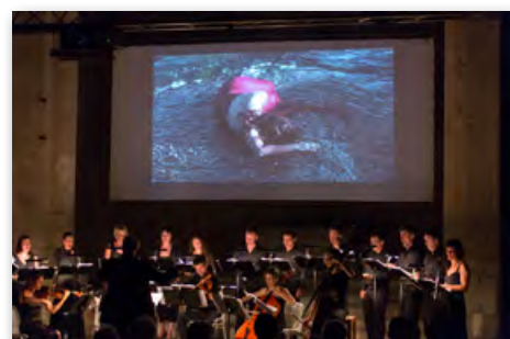
Abbaye de Silvacane La Roque d'Anthéron 22 août