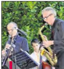
Le Kirby Memory dans les Jardins du château d'Arnajon.