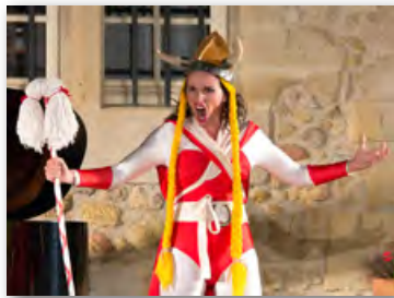
Château Mirabeau 9 août