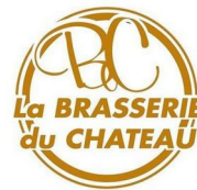
La BRASSERIE du CHATEAU