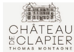
CHATEAU DE CLAPIER THOMAS MONTAGNE