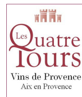
Les Quatre Tours Vins de Provence Aix en Provence