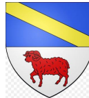
LA TOUR D'AIGUES