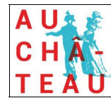
LA TOUR D'AIGUES