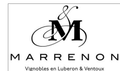
MARRENON Vignobles en Luberon & Ventoux