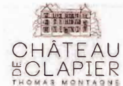
CHÂTEAU DE CLAPIER THOMAS MONTAGNE