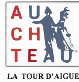
LA TOUR D'AIGUES