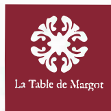
La Table de Margot